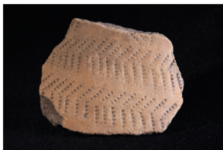
Tesson à décor imprimé au cardium (Basi – A Sarra di Farru)