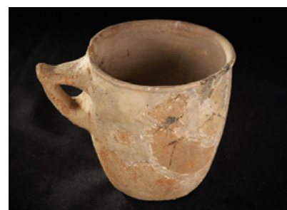
Tasses monoansées 1800-1600 avant J.C, ( Settiva, Pitretu è Bicchisgià )