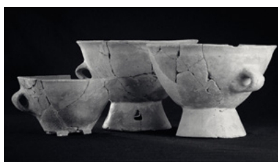
Grandes coupes à pied haut fenestré ( Castellucciu – Sartène )