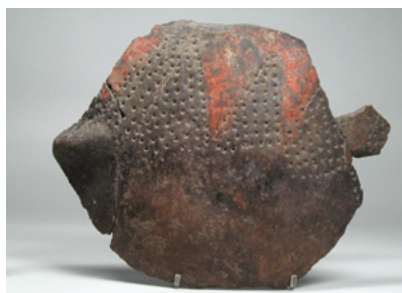
Tesson à motif géométrique peint (Basi – A Sarra di Farru)