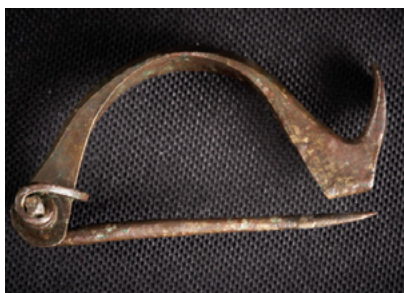
Fibule de type Corsi (Teppa di Lucciana – Vallecalle )