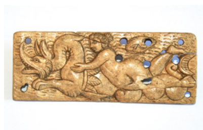
Panneau de coffret décoré d'une scène de thiasos marin ( Castellucciu – Corti )