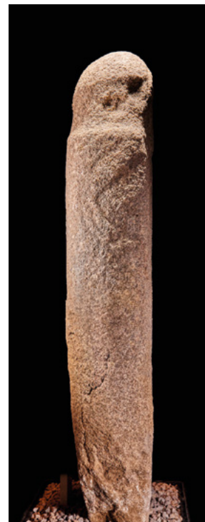
Statue-menhir armée ( Portigliolu – Pozzacciu - Coti Chjavari )