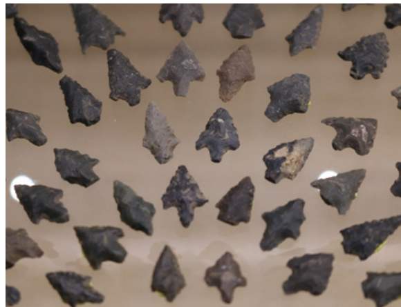
Pointes de flèches en rhyolite ( I Calanchi Sapar'Alta - Suddacarò )