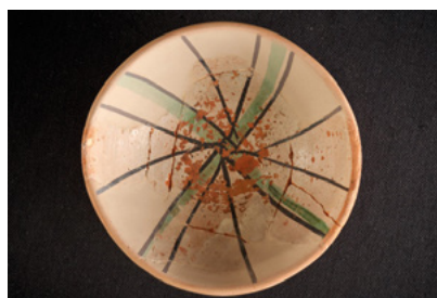
Bol à décor vert et brun production majolique archaïque, ateliers (Castellu di Sià – Ota)