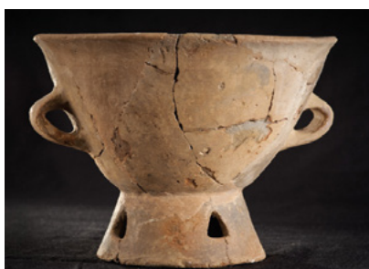
Grande coupe à pied haut fenestré ( Castellucciu – Sartène )